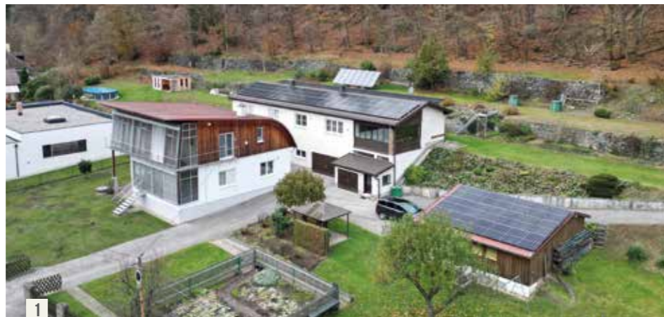
Die beiden Wohnhäuser werden über zwei Luftwärmepumpen, einen bei Bedarf zuschaltbaren Pelletskessel, eine Solaranlage und eine PV-Anlage mit Stromspeicher energetisch versorgt.

Die nächste Station machen wir im Kärntner Finkenstein am Faaker See. Hier hat die Familie Stauder ihre alte Gasheizung gegen eine leistungsstarke Split-Luftwärmepumpe ersetzt, die sich für die Wärmeverteilung mit den bestehenden Heizkörpern eignet. Nachdem sich der Aufstellungsort der Außeneinheit im Freien recht nah an der Thujenhecke zum Nachbargrundstück befindet, kam hier nur ein sehr leises Modell infrage. Das Warmwasser wird von einer eigenen Brauchwasser-