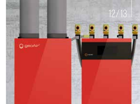
Das Lüftungsgerät geoAir von WEIDER kombiniert Lüftung und Erdwärme. Die Erschließungskosten von Erdwärmequellen lassen sich damit um bis zu 50 % reduzieren.