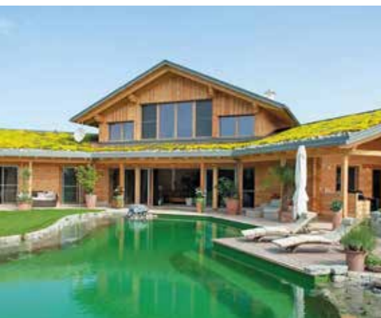
Ökohaus mit Erdwärmepumpe/Flächenkollektor