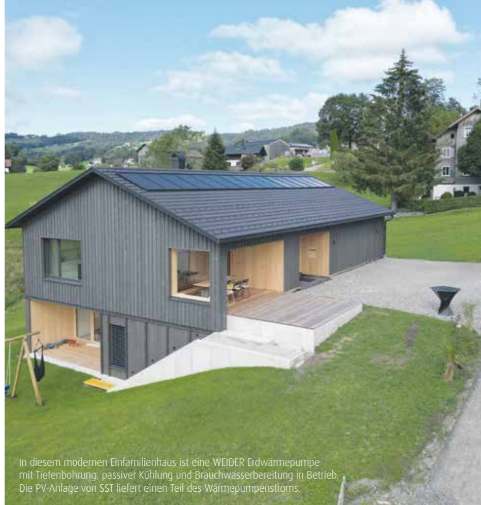
In diesem modernen Einfamilienhaus ist eine WEIDER Erdwärmepumpe mit Tiefenbohrung, passiver Kühlung und Brauchwasserbereitung in Betrieb. Die PV-Anlage von SST liefert einen Teil des Wärmepumpenstroms.