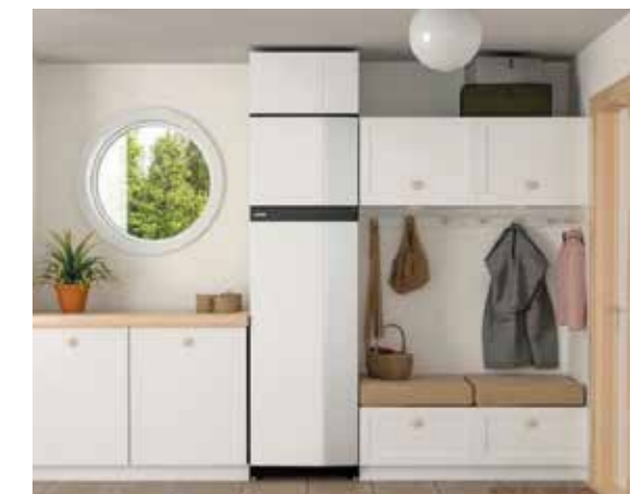
Die Luftwärmepumpe S735 (Abluft) von KNV braucht nur wenig Platz und wurde eigens für den Einsatz in Passiv- und Niedrigstenergiehäusern entwickelt.