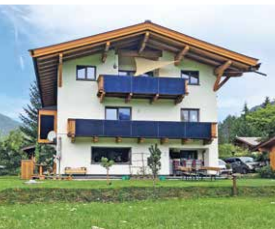
Zweifamilienhaus mit Erdwärmepumpe/Tiefenbohrung