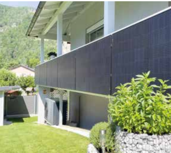
SONNENKRAFT PV-Balkon und Luftwärmepumpe