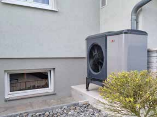
Außeneinheit einer Monoblock-Luftwärmepumpe